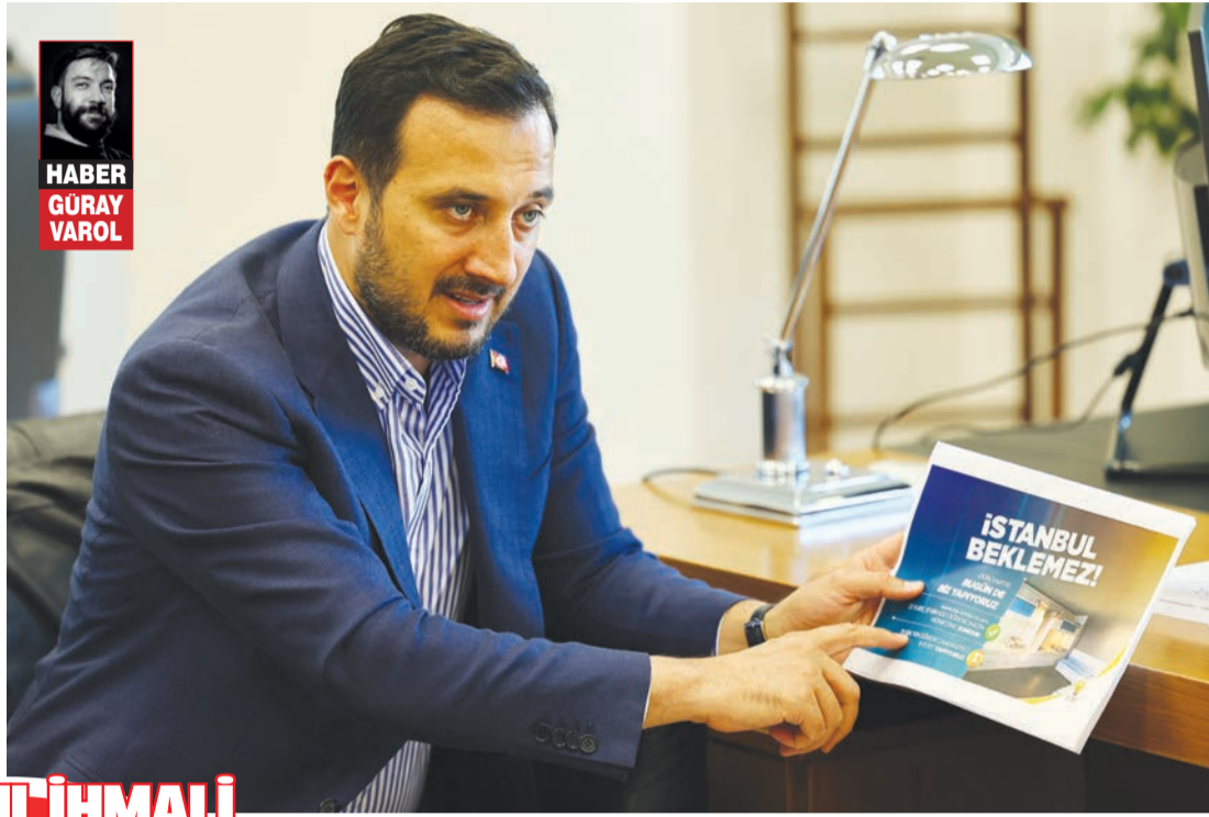
HABER GURAY VAROL

Özdemir, "Deprem beklemez. Ulaşım beklemez. Gençliğimizin geleceği beklemez. Sağlık yatırımları beklemez. İstanbul gibi dünya ölçeğinde bir şehrin kaybedecek tek bir günü bile yoktur." dedi. Kampanyanın temel mesajının "Dün yaptık, bugün de biz yapıyoruz" anlayışı olduğunu vurgulayan Özdemir, AK Parti'nin eser ve hizmet siyasetini sürdürdüğünü belirtti. İstanbul'da devam eden yatırımlara dikkat çeken Özdemir, 2019'dan bu yana 994 bin konutun dönüştürüldüğünü, 270 bin konutun dönüşümünün sürdüğünü ve 1 milyon 260 bin konutun daha dönüşüm kapsamına alındığını ifade etti. Gençlik ve eğitim alanında ise 10 gençlik merkezini hizmete açıldığını, 10 yeni gençlik merkezinin yapımının sürdüğünü belirten Özdemir, 13 yurtta 37 bin 632 öğrenciye hizmet verildiğini, 19 bin 709 öğrenci kapasiteli 9 yeni yurdun da inşa edildiğini kaydetti.